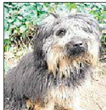
Ein Herz für Hunde